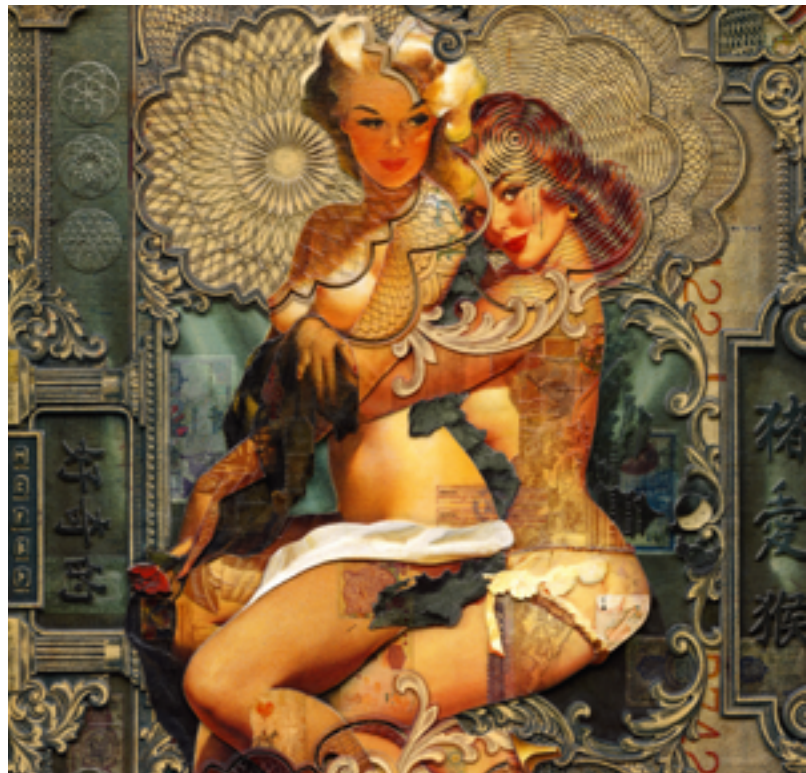
HANDIEDAN «Amphitrite Large» 2020 Tirage d'art (détail)