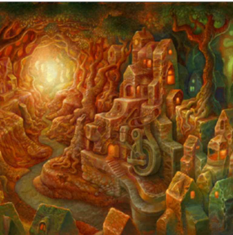
CHRIS MARS «The Way There» huile sur panneau de bois, 2020 (détail)