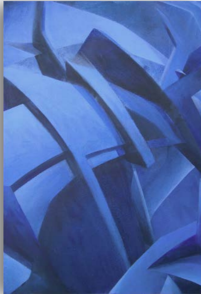
IMPUR T Acrylique sur toile encolée sur isorel 74,5 x 49,6 cm, 2006 Toile avec encadrement Signée et datée au dos. 2 900 €