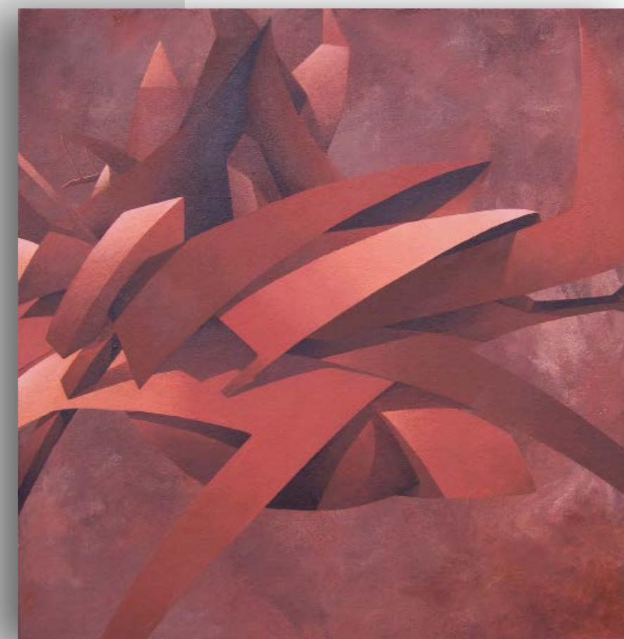
CHIMÈRE Acrylique sur toile Encollée sur isorel 49,4 x 48,2 cm, 2006 Signée et datée au dos.