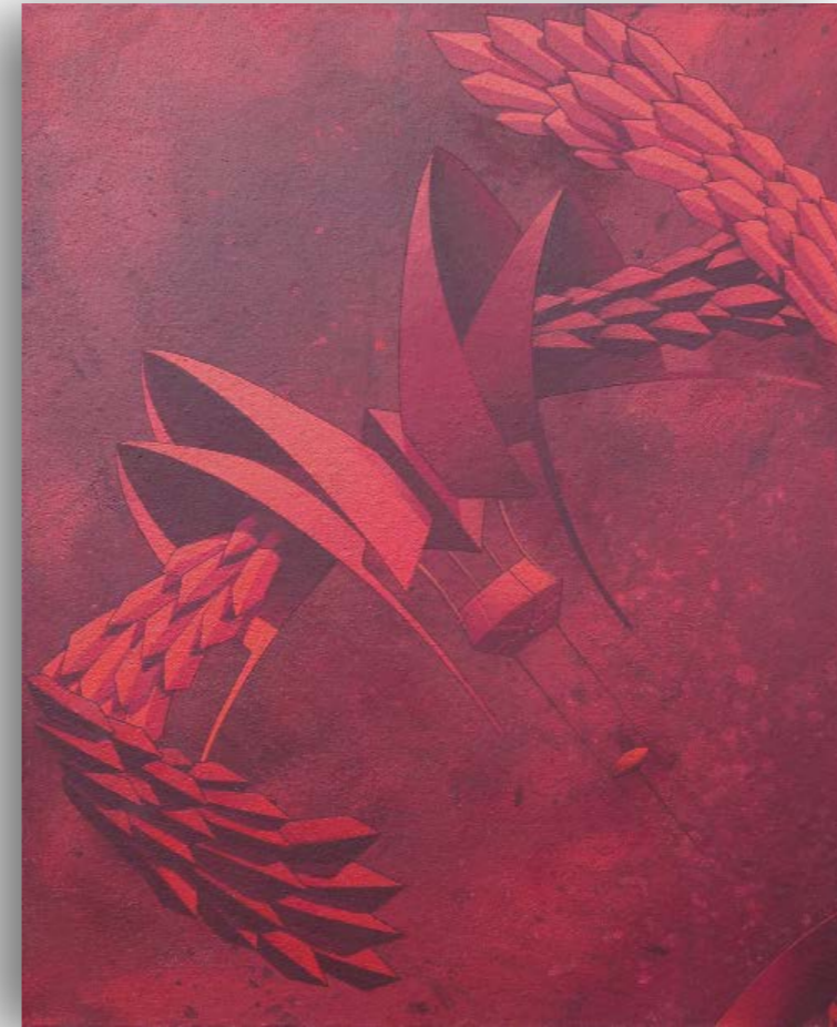
LE MESSENGER Acrylique sur toile encolée isorel 49,6 x 40,1 cm, 2006 Signée et datée au dos. 1 600 €