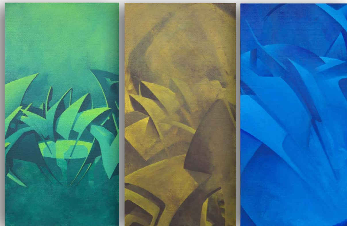
Tryptique - AUTO PORTRAIT Le calme avant la tempête + Le chaos intérieur + La recherche de la sérénité Acrylique sur toiles encollées sur isorel 3x (68,8 x 34,2 cm) / 68,8 x 102,6 cm, 2006. Toiles avec encadrement Signées datées au dos.