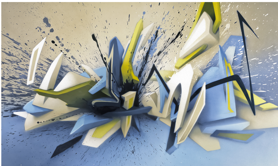
COLD MOUNTAIN VIEW - spraypaint on canvas, 140 x 240 cm, 2005