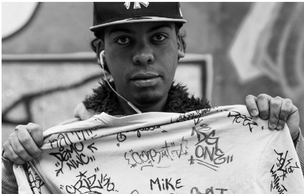
© Selector Marx « Escritores » New York, 2014