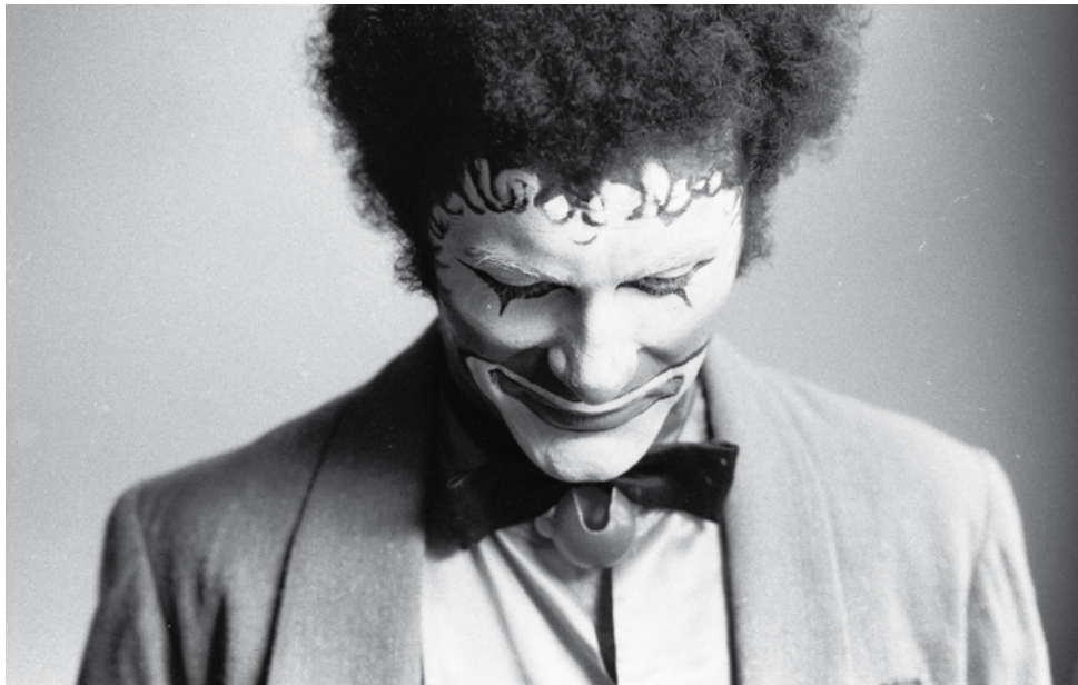
©Yves Brumaire «CLOWN», Théâtre du Soleil (Aubervilliers) 1969

Né en 1941 à Tunis . Mort à Paris en 2001